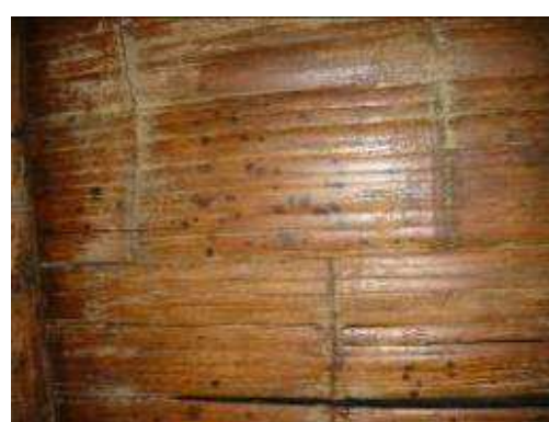
Estructura y techo en guadua y esterilla, completamente afectada de hongos