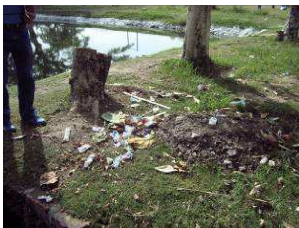
Disposición de residuos en áreas de desagüe y zonas verdes de la Institución