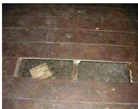
Pisos deteriorados por acciones vandálicas