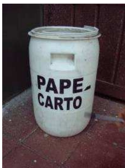
Recipientes dispuestos en áreas del colegio para disposición selectiva