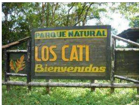
Entrada al Parque Los Catíos

Se evidencia una deficiente gestión municipal frente a las acciones desarrolladas en el Parque natural los Catios, por cuanto pese a las inversiones desarrolladas a través del convenio No.129/03, además de las efectuadas en el 2007 y 2008, principalmente en mantenimiento, se constató durante visita al Parque, estado de enmalezamiento, deterioro y abandono del área, daños en instalaciones eléctricas, hidráulicas y en la infraestructura en madera, alto grado de hongos en ésta, quema de residuos sólidos a cielo abierto. No se cuenta con una adecuada vigilancia, ni administración del Parque, que garantice la sostenibilidad de las inversiones efectuadas tanto por la CVC como por el municipio, evidenciándose que no se ha cumplido con el objetivo de convertirlo en un Centro de Educación Ambiental, donde se facilite además la realización de estudios e investigaciones de carácter ambiental. Así mismo esta área, catalogada en el Esquema de ordenamiento territorial como suelo de protección, no cuenta con un Plan de manejo ambiental que permita su protección y conservación.