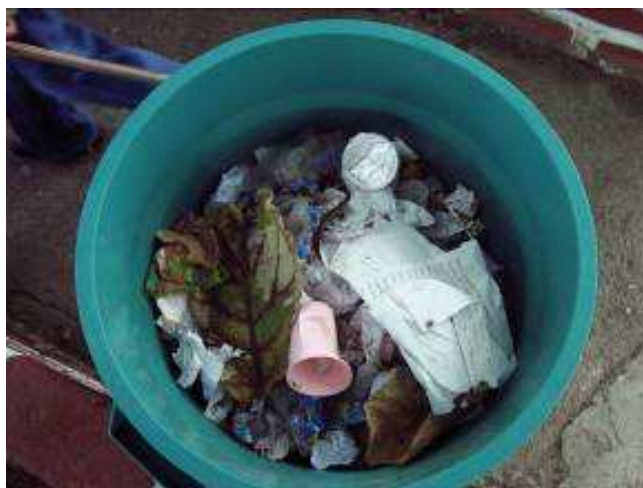
Disposición de residuos sólidos de manera discriminada