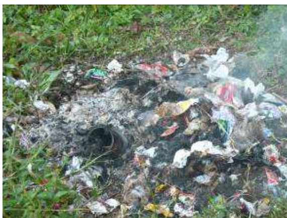
Quema de basuras a cielo abierto, afectando el entorno