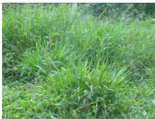
Alto estado de enmalezamiento