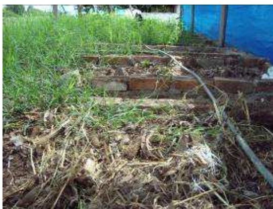
Eras de lombricomposto en estado de abandono y enmalezadas