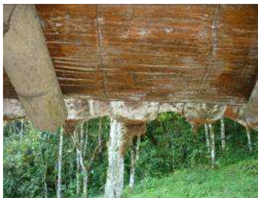
Techos en mal estado interior y exteriormente