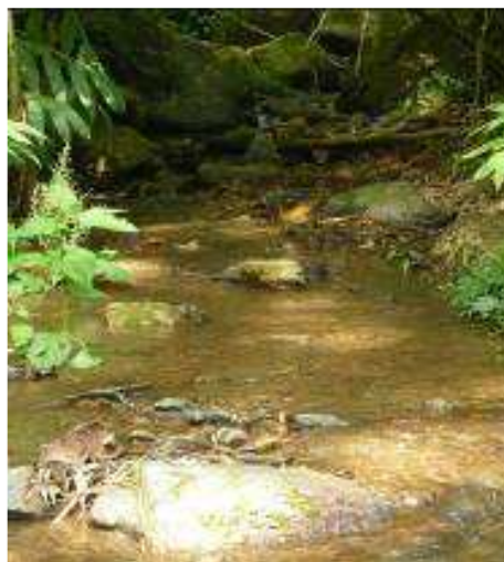
Quebrada El Guineo