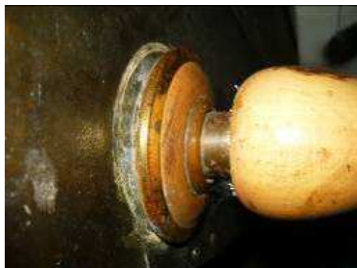
Daños en Instalaciones eléctricas y chapas de puertas