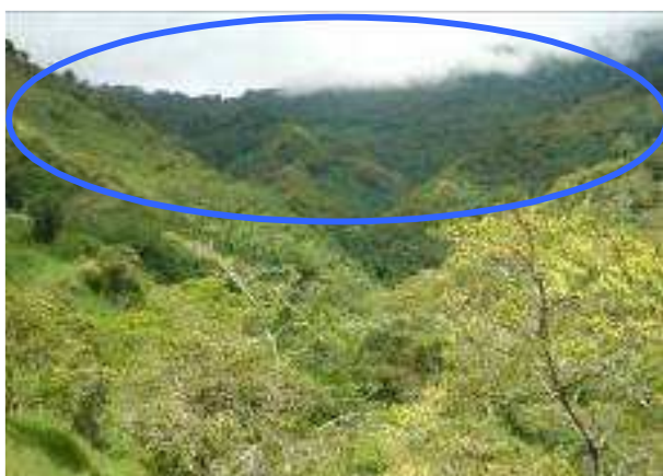
Panorámica del predio La Soledad

En visita a la vereda El Bosque, se observó panorámica del predio, en la parte baja se encuentra la quebrada El Guineo, abastecedora del acueducto veredal. Se observaron algunas plantas de café dentro del predio, desconociéndose los fines de éstas, el predio no está alinderado.