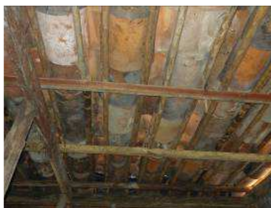
Techo reparado en caña menuda y teja de barro