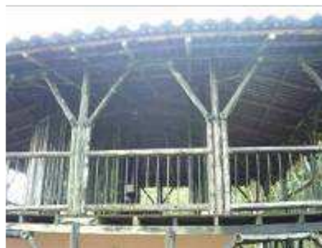
Estado de deterioro