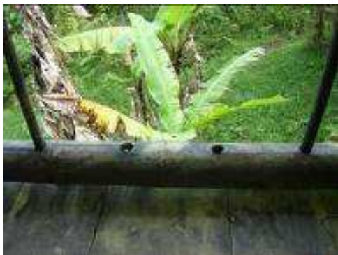
Daños en estructura de madera