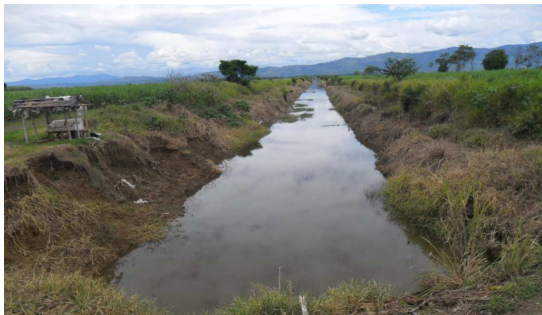
Humedal Mojahuevos cgto. Molina