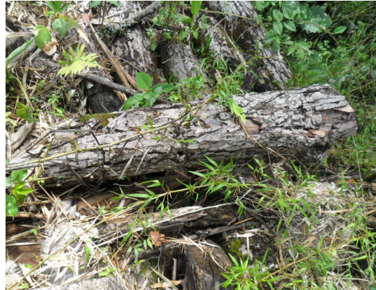
Procesos de deforestación- tala de árboles en linderos del predio El Amparo

Se determina en dicha reunión compromisos con el dueño del predio colindante y solicitar al Agustín Codazzi la definición de linderos del predio El Amparo.