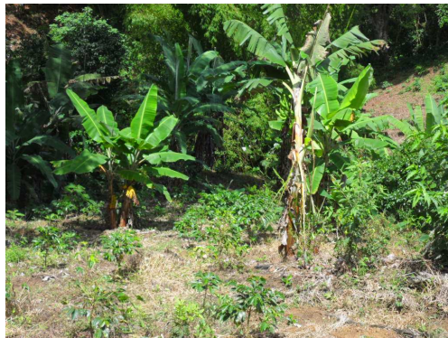
Cultivos de café y plátano en la zona de frontera, sitio de conservación del predio El Amparo de propiedad del municipio

Se encontraron los soportes de pago, sin embargo se hace necesario evidenciar el producto del objeto del contrato, el único soporte es un plano topográfico y demás soportes técnicos del topógrafo.