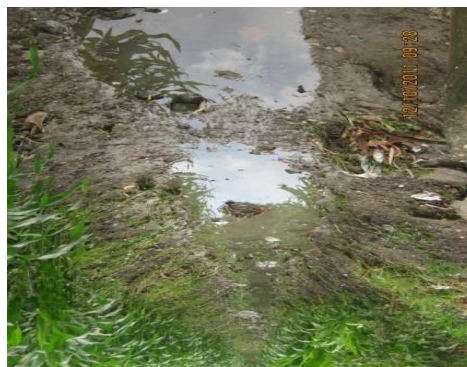
Canal de aguas lluvias de los barrio los Almendros y barrio Santander