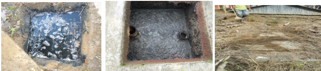
Pozos sépticos con presencia de hipoclorito - colmatados, cubiertos de maleza- corregimiento Frías

En visitas efectuadas al área rural, con el propósito de verificar el estado de los pozos sépticos, se observó: En el corregimiento Frías se visitaron seis usuarios y en el Corregimiento de San José un usuario, encontrando que el estado general de los sistemas sépticos es deplorable, falta de mantenimiento periódico y en estado de colmatación. Problemas de trampas de grasas, manejo de lodos, deterioro del sistema séptico, y filtro anaeróbicos, se les hace mantenimiento de un año o dos.