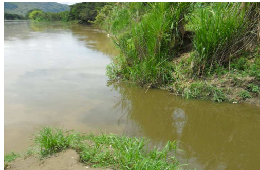
Sitio donde el rio cauca vierte sus aguas al Humedal Mojahuevos