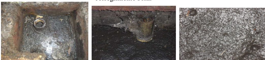
Pozo séptico en el correg. de San José

El estado de los pozos sépticos visitados refleja la ineficiencia en los procesos de la capacitación a los beneficiarios para el buen funcionamiento, manejo y mantenimiento de los sistemas, no cumpliendo con su objeto de descontaminación del recurso hídrico y por el contrario generando impacto negativo y riesgo sobre la salud humana. .