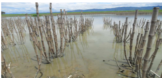
Estado de los humedales como producto de las inundaciones, sembrados de caña