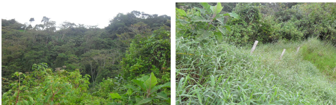
Vistas parciales del predio Buenavista vereda el Zande

técnico y su viabilidad por parte de CVC. Cabe precisar que en el formato F11 rendido en Sircvalle, no se describieron las características del predio, para identificar la microcuenca beneficiada, la población y demás datos solicitados.