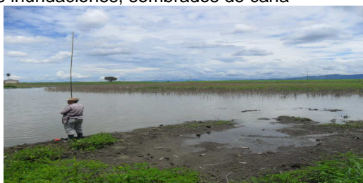
humedal la florida

El estado actual de la quebrada el naranjo a su paso por la zona urbana por el barrio las Brisas