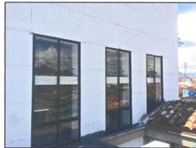
FOTO DE LOS MISMOS VITRALES DEEL ALTAR CON LA VENTANA HERMETICA QUE SOLUCIONO LAS FILTRACIONES Y POR ENDE LAS HUMEDADES

La interventoría mediante comunicación oficial C.C 43007 del 11 de septiembre de 2017 con radicación CACCI-6107, manifestó: