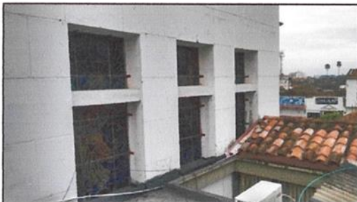
FOTO DE LOS VITRALES CON FILTRACION GENERANDO HUMEDADES

R/ La explicación técnica de los descascaramientos en la pintura de la Catedral a nivel de las partes altas donde aparecen los vitrales en la fachada lateral izquierda y lateral derecha, se presentan por las humedades que se generan porque los vitrales no tienen un tratamiento de mantenimiento que permita el sellamiento de las juntas entre los vidrios que conforman el vitral y los marcos (impermeabilizaciones no incluidas en el contrato con la Fundación TDH a realizarse por parte de la Diócesis de Cartago de manera posterior). Es de anotar que en los vitrales del altar se realizó tratamiento exterior por parte de la Diócesis de Cartago, para evitar esas humedades, instalando ventanas herméticas por fuera del vitral, con el fin de evitar las filtraciones que generan la humedad de los muros aledaños y por ende los descascaramientos de la pintura. Anexo registro fotográfico de lo expuesto, que corrigió la humedad en esos vitrales. Hecho este que demuestra que si es por humedad.