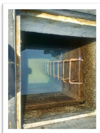
Registro fotográfico de las instalaciones del acueducto