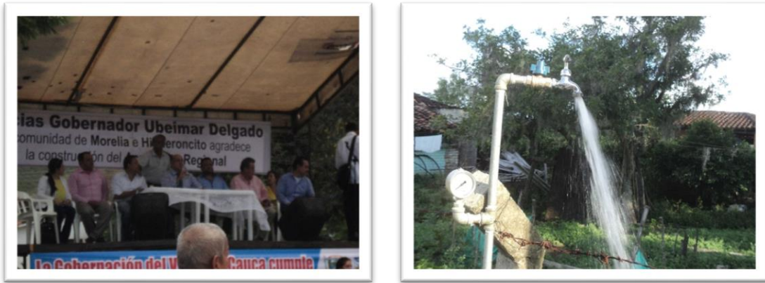
Registro fotográfico de la entrega del Acueducto a la administración anterior

El 28 de diciembre de 2015, el Municipio de Roldanillo firma un contrato de operación por 20 años con la empresa Aquahiguerones S.A. E.S.P. Contrato que nunca se ejecutó. Es importante resaltar que todos los documentos del proceso licitatorio que dio origen al contrato, el acto de apertura del proceso licitatorio, el informe de evaluación de ofertas y el acto administrado de adjudicación del contrato, se encuentran sin firmas.