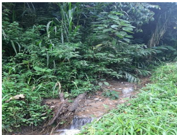
2.) Quebrada Brisas