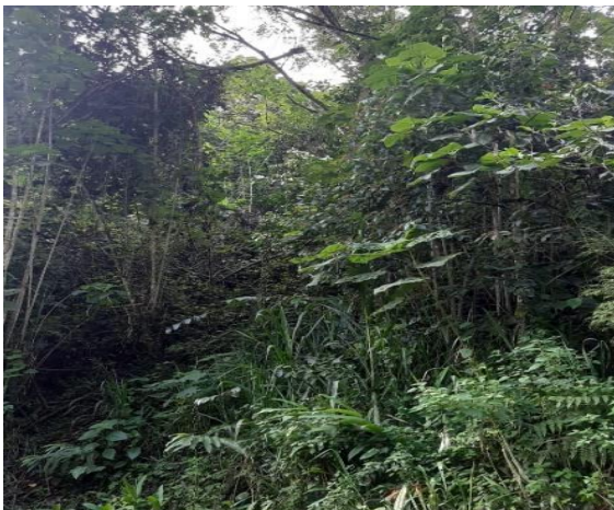
3.) Predio la Ponderosa Convergencia de nacimientos