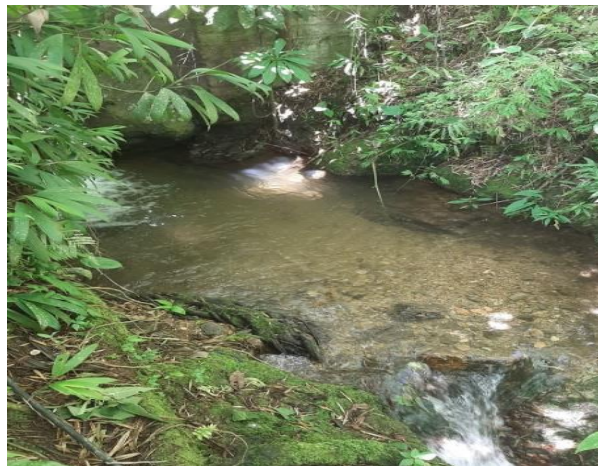
4,) Quebrada Maracaibo