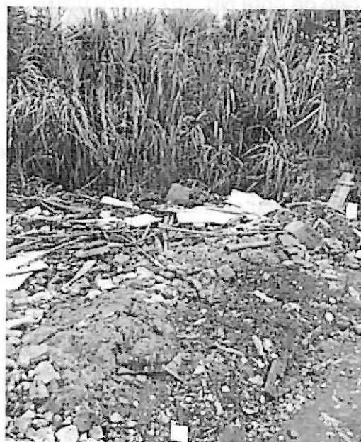
Margen derecha Rivera del rio- Riofrio parte urbano