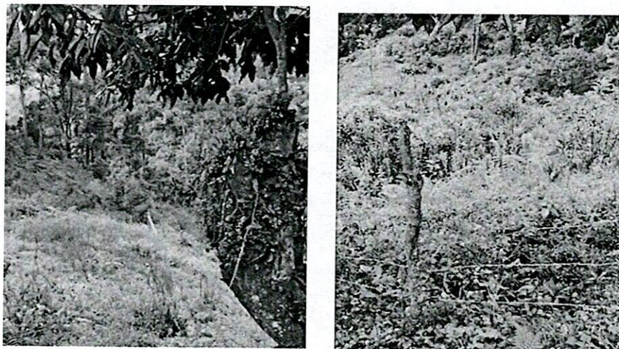
Predio alto bonito, aislado pero sin vallas informativas

Riesgos en el cambio de usos del suelo y contaminación de las fuentes hídricas Protegidas.