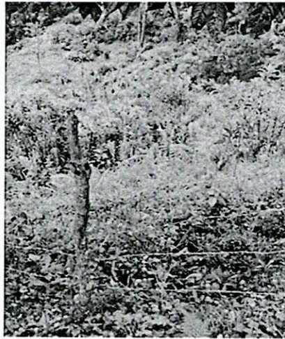
Predio alto bonito, aislado pero sin vallas informativas