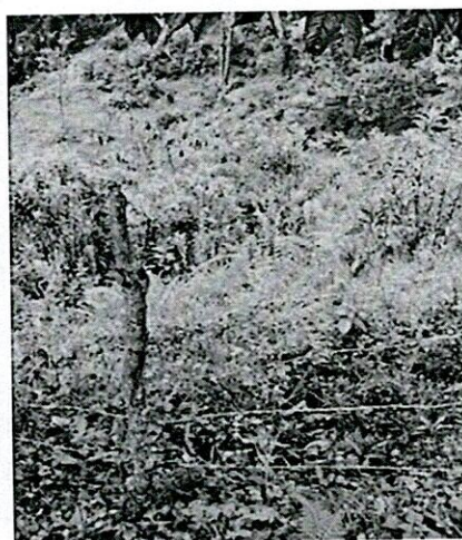
Predio alto bonito, aislado, pero sin vallas informativas