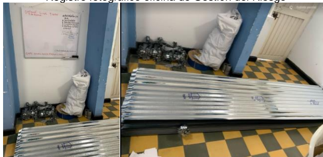
Registro fotográfico oficina de Gestión del Riesgo

Se observó en la oficina de gestión de riesgo elementos entregados como láminas de zinc, las cuales no tiene las condiciones físicas para el almacenamiento y genera riesgo para las personas que ingresan a dicha oficina.