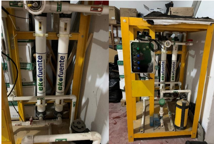
Foto tomada en el almacén del municipio de San Pedro Valle por el equipo auditor