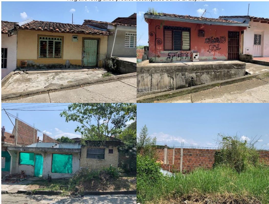
Registro fotográfico predios desalojados Barrio El Espinal