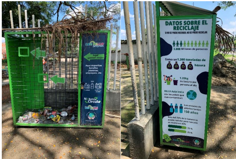
Punto ecológico Corregimiento de Presidente