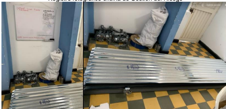
Registro fotográfico oficina de Gestión del Riesgo

Se observó en la oficina de gestión de riesgo elementos entregados como láminas de zinc, las cuales no tiene las condiciones físicas para el almacenamiento y genera riesgo para las personas que ingresan a dicha oficina.