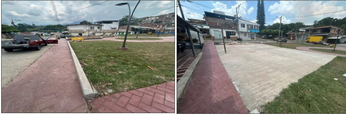
Elaborado por equipo auditor

Sin embargo, se evidenció una segunda modificación al contrato por medio de una Adición No.2 solicitando un plazo adicional de 35 días calendario para la culminación de actividades relacionadas con el acta No.2 justificadas por el contratista anteriormente.