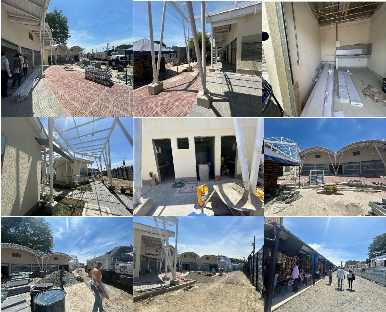
Ilustración 6. Registro fotográfico

A continuación, se muestran las actividades ejecutadas hasta el acta no. 6, por parte del contratista: