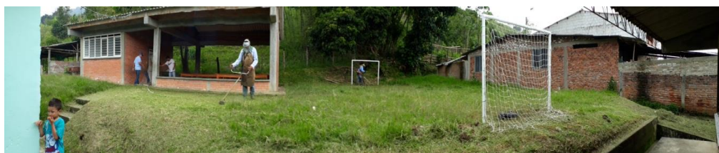
Parque Barrio Valle Real