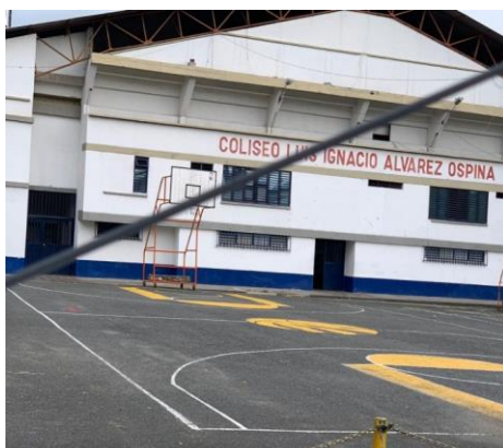
Escuela La Magdalena