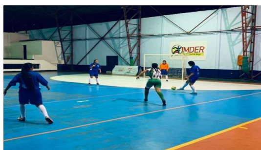
Cancha Auxiliar de Fútbol