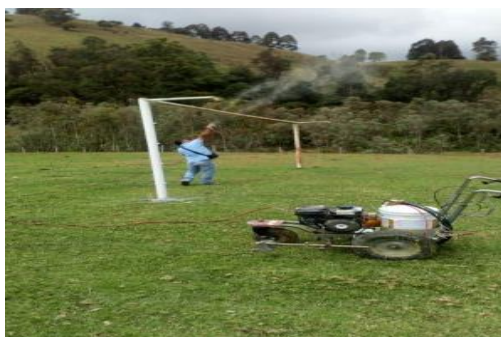
Zona Rural: SANTA ROSA