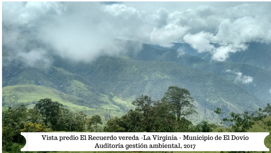
Vista predio El Recuerdo vereda -La Virginia - Municipio de El Dovio Auditoría gestión ambiental, 2017