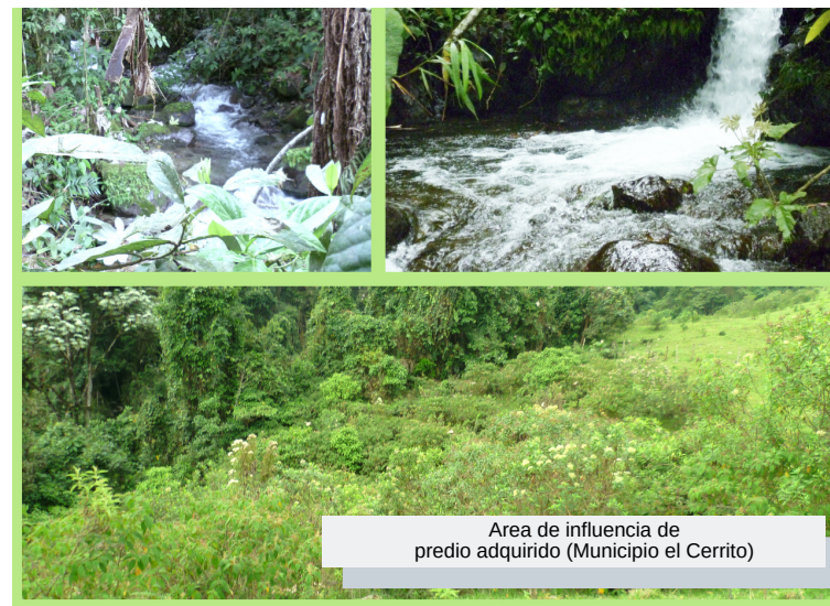
Área de influencia de predio adquirido (Municipio el Cerrito)

UNA ESTRATEGIA PARA LA SUSTENTABILIDAD DEL RECURSO HÍDRICO