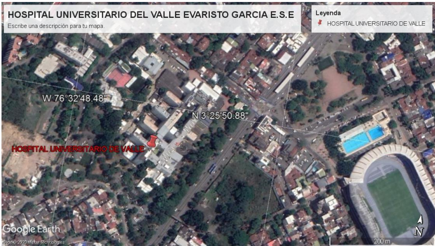
Elaboración propia-Google Maps