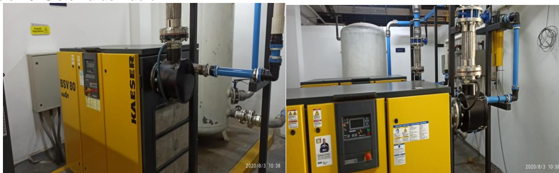
Ilustración 6. Sistema de Vacío

Se pudo evidenciar un sistema de vacío donde se encuentran 2 bombas, de las cuales solo con el funcionamiento de una bomba se logra la cobertura del 100% del hospital y la otra se utiliza para emergencias en caso de que la otra falle. Las dos bombas se encuentran en buen estado y en funcionamiento.