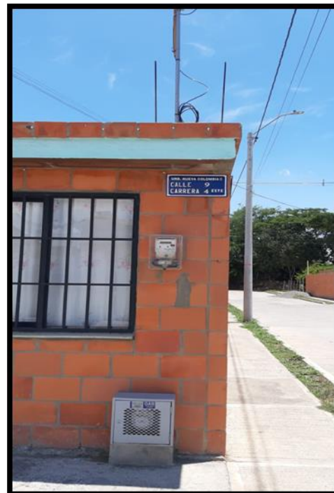
Urbanización Nueva Colombia Etpa II