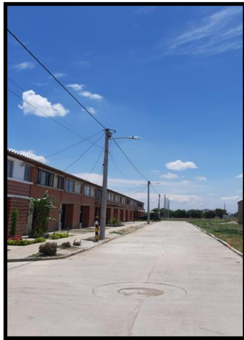
Urbanización Bosques del Limonar