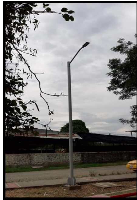
Parque Biosaludable Santa Helena

Por lo anterior se realizó un selectivo para la visita y se revisaron cinco (5) parques, todos con las mismas características constructivas y su componente de iluminación consistente en 4 postes, 4 luminarias led con su respectiva fotocelda, postes metálicos y su medición.