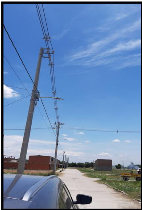
Urbanización prados de la Luisa