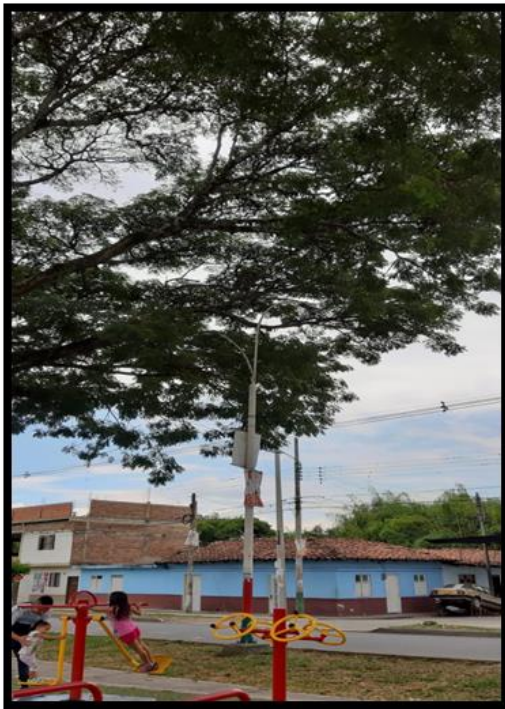
Parque Biosaludable la Paz Antonio

A continuación, se extraen las evidencias fotográficas de los sitios visitados: