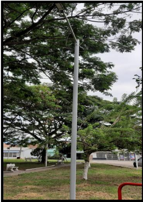
Parque Biosaludable El placer