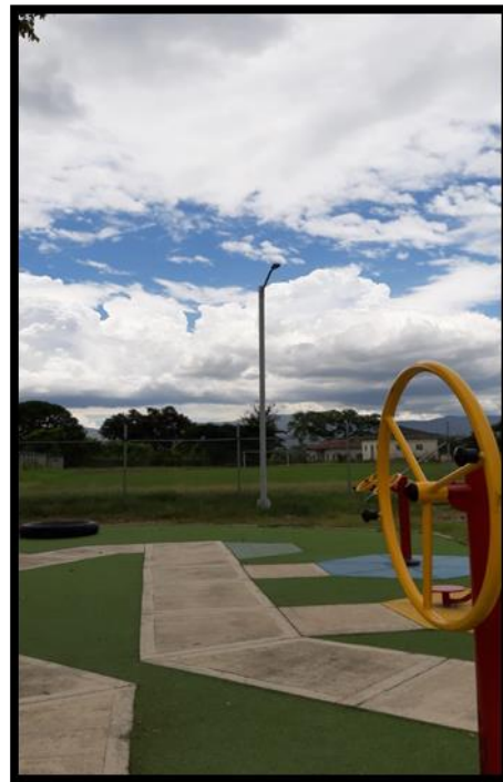
Parque Biosaludable lado cancha San