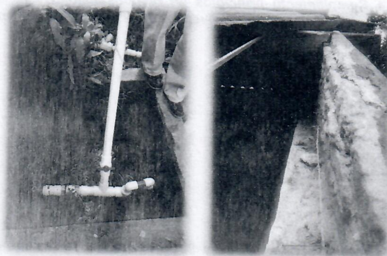
Registro fotográfico Acueducto el Rosario