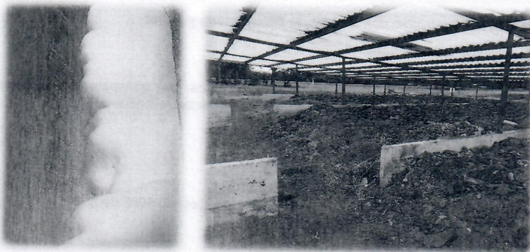
Registro fotográfico de la salida de la PTAR y de los lechos de secado

procedimientos para la correcta disposición final de los lodos de los lechos de secado, esto debido a la posible presencia de cromo provenientes de las actividades de curtiembres en el municipio.