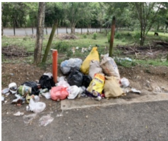
Fotos: Depósito de basura en El Tablazo

Con esta situación se induce a que el riesgo de contaminación por residuos sólidos se materialice, afectando el medio ambiente y generando la propagación de vectores y enfermedades, entre otros.