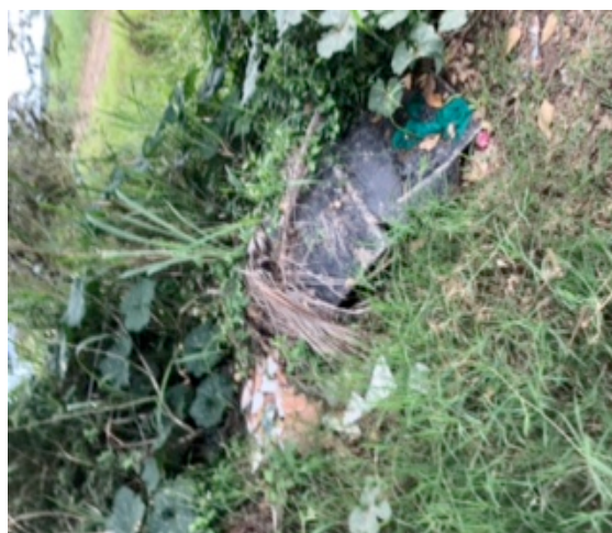
Escombros en el barrio Las Delicias